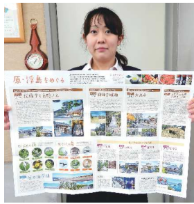
観光マップ 深海魚ポスター