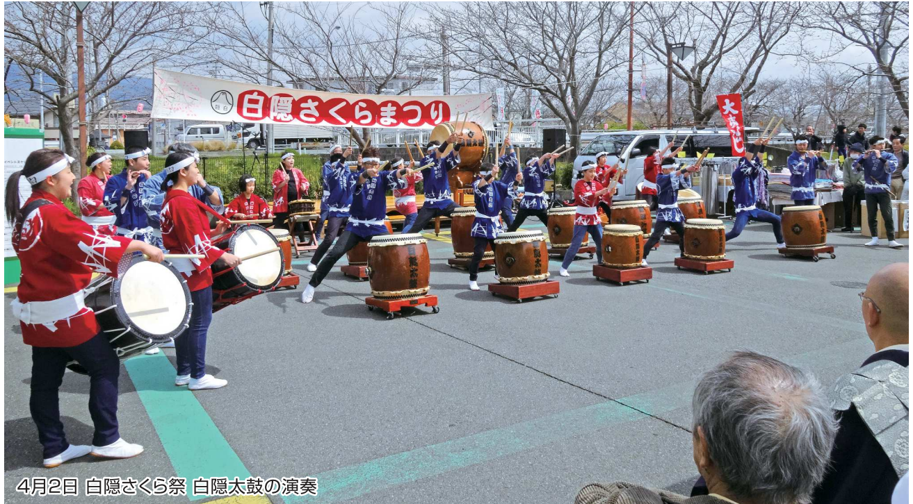
4月2日 白隠さくら祭 白隠太鼓の演奏

No. 92 発行者 沼津市商工会 会長 大村保二 〈本所・原支所〉沼津市原1200番地の1 TEL(055)966-1331 FAX (055)967-4925 〈戸田支所〉沼津市戸田1028番地の5 TEL(0558)94-2224 FAX (0558)94-4029 編集 沼津市商工会広報委員会